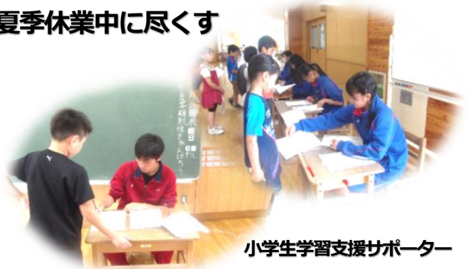
小学生学習支援サポーター

今年も多くの生徒が、校区内3つの小学校に「学習支援サポーター」としてお邪魔させていただきました。主な業務は、「〇つけ」であったようですが、問題がわからず困っている児童に積極的にヒントを与えるなど、学びのサポーターとして、しっかり貢献することができたようです。教えることで逆に学ぶことも多くあったようです。